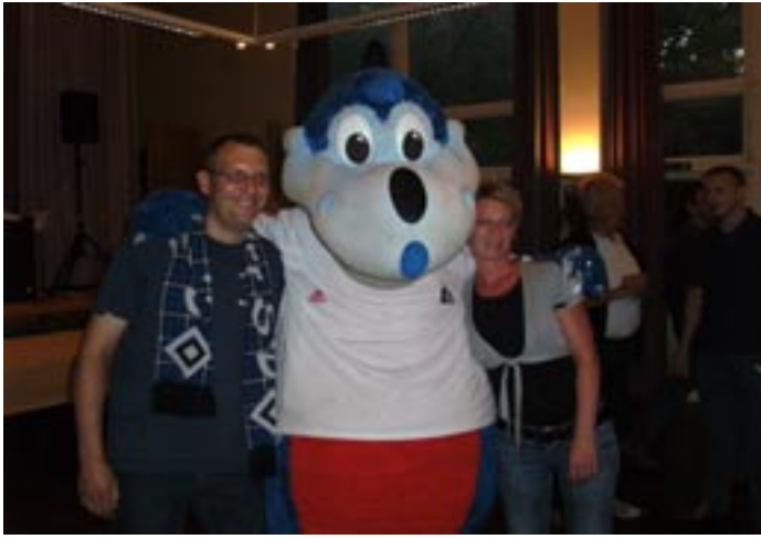
Alle dürfen mal .... mit dem Dino fotografiert werden. Tja, wer hätte das gedacht. Im wahren Leben ist der Dino soooo weit von uns weg.