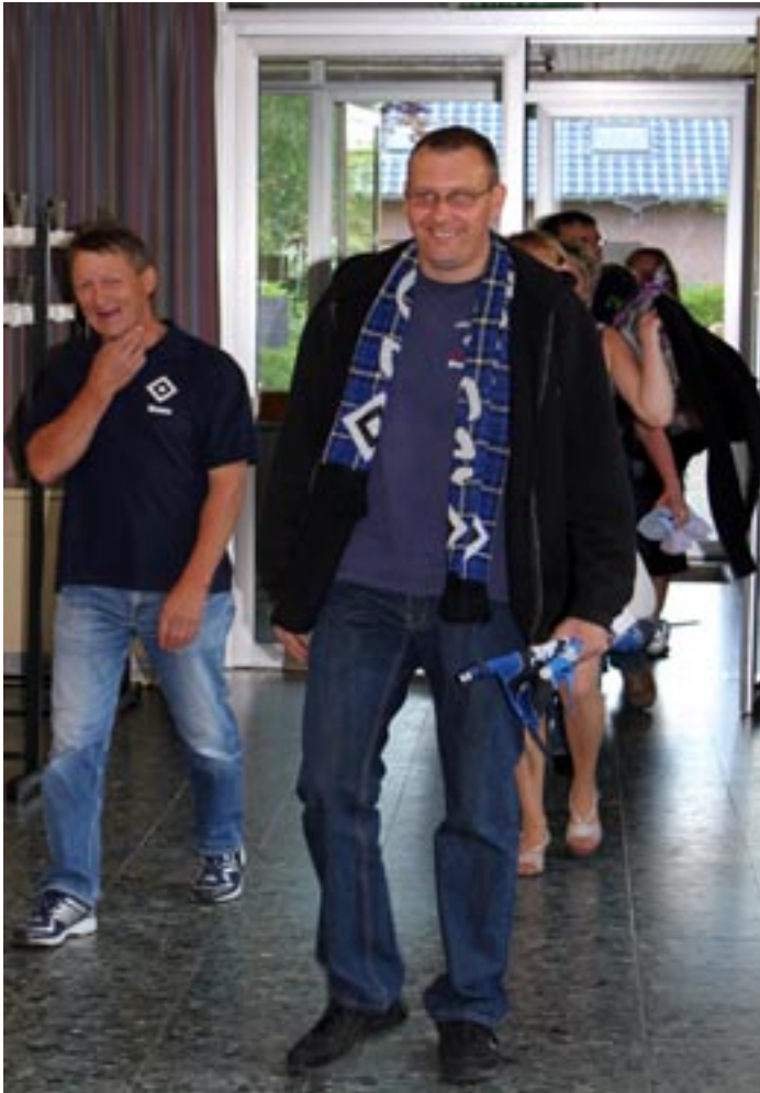
Die Prominenz aus Hitzacker ist angereist und betritt die Arena in Schnega DGH.