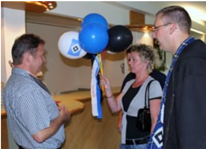
Kleines Präsent: Schwarz (lila), weiß blaue Luftballons für den Vorsitzenden des Festausschusses.