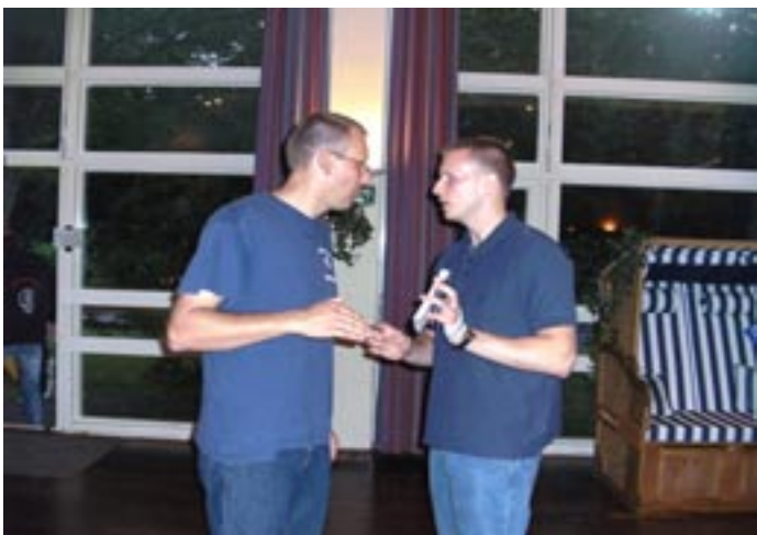
Mit dem Management noch schnell die Feinheiten klären!