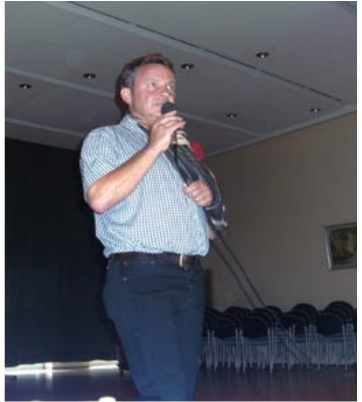
Alle sind da!!! Das Geburtstagskind kann die Party eröffnen. Zum Glück begrüßt er nicht jeden Einzelnen, sondern er kämpft sich Tisch für Tisch vor.