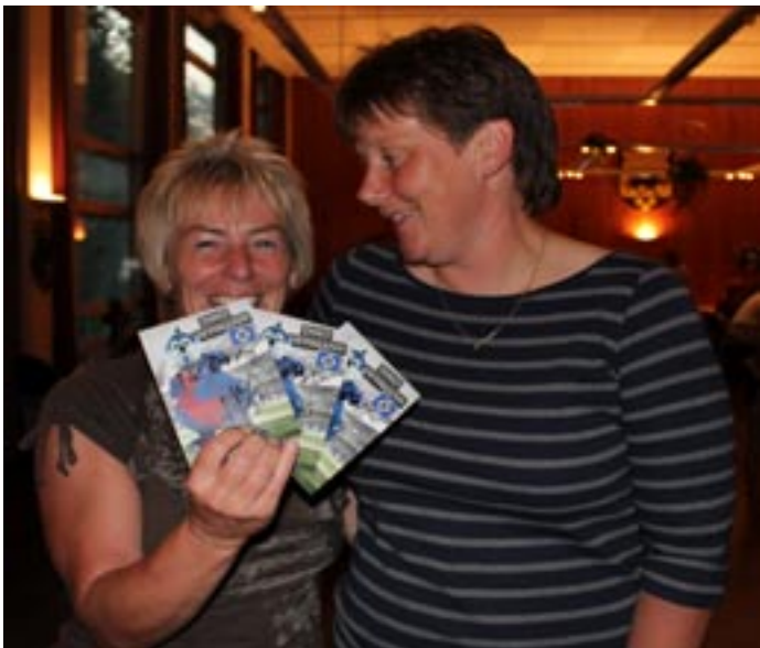
„Hurra, ich habe drei Original-Autogramme vom Dino bekommen“. Da kommt Freude auf. Und mal ganz im Ernst: Es waren nicht nur HSV-Fans, die sich Autogramme beim Dino abgeholt haben. Leider konnten nicht alle abgelichtet werden. Wir wollen ja nicht so kleinlich sein... Alles wird gut!