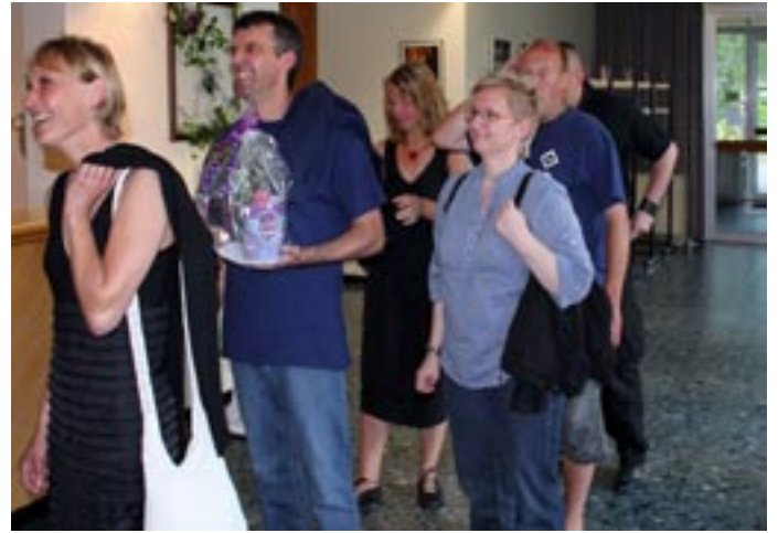
Der HSV Fanclub „Doll in Vaart“ erobert den Südkreis in Schnega mit Blumen und Geschenken.