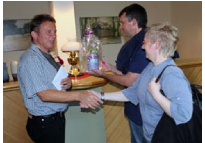
„Herzlichen Glückwunsch“ ... dem kranken Geburtstagskind - bloß nicht auf die Schulter klopfen!! Nur die Karten (mit dem Geld) in die rechte Hand!