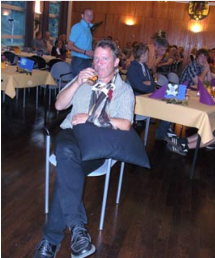
„Singen können sie ja ganz ordentlich, das kann ich mir ja mal merken“. Gut für die nächsten Fan-Club-Feiereien!