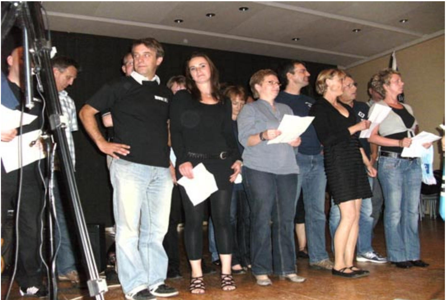
Der HSV-Chor singt .... und leitet die erste Überraschung ein! Schauen mer mal!