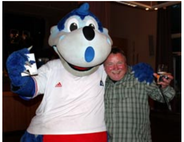
„Uff, Freude, aber können wir als Freundeskreis diese Überraschung mit unserer Vorführung noch toppen?“ Der Pressewart ist aber auch immer im Stress! Und dann drückt einen noch dieses gewaltige Monster eng an sich.