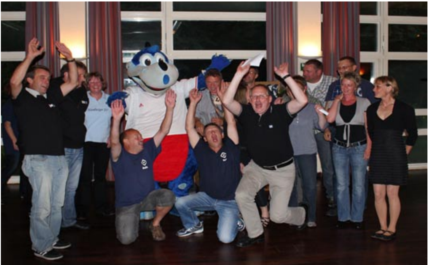
Fast wie im Stadion: Hey, hey, hey: Wir sind alle Hamburger Jungs! Und hier regiert der HSV!!!