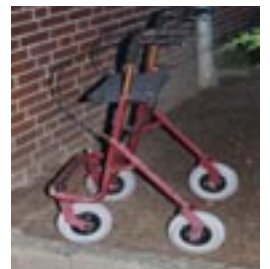
Ist unser Dino mit dem rechts abgebildeten Fahrzeug aus Hamburg angereist? Wir wollen keine Werbung fürs DRK machen, aber Willy Tiedtke darf das!