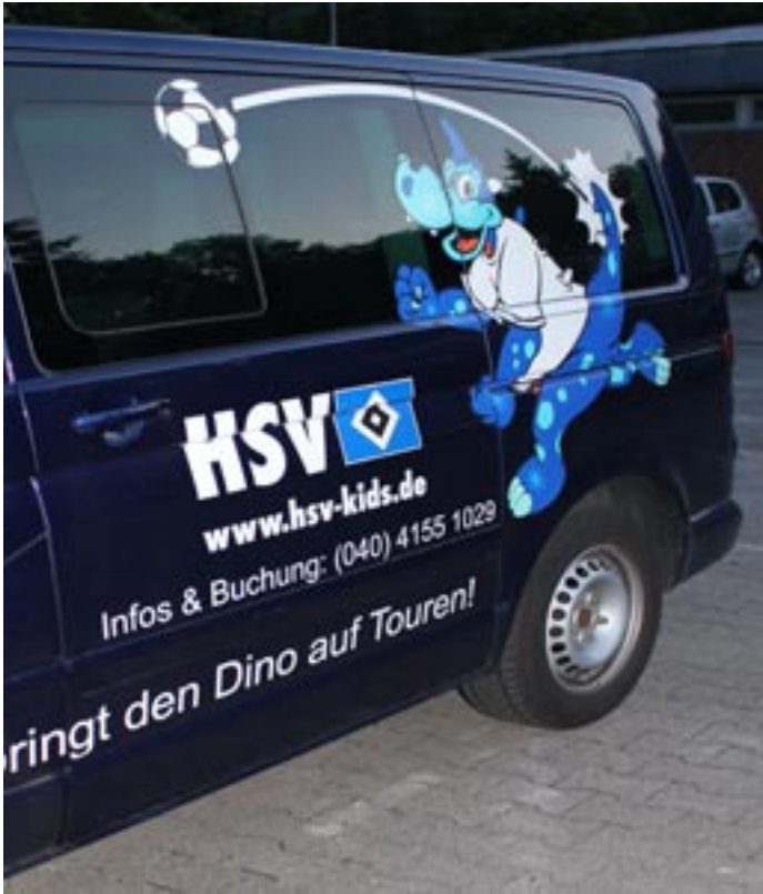
Hier kannst Du den Dino buchen: Und er bringt auch Dich auf Touren!